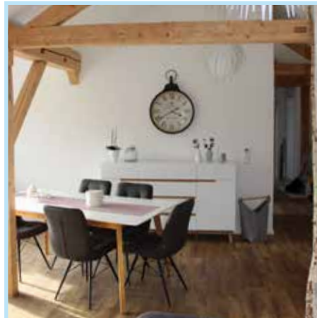
Boden Endbelag: Holzboden schwimmend verlegt