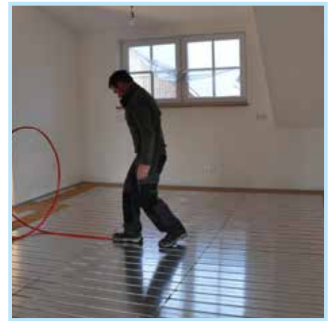
Boden Lage 4: PowerFloor Light Fußbodenheizung mit Trennlage