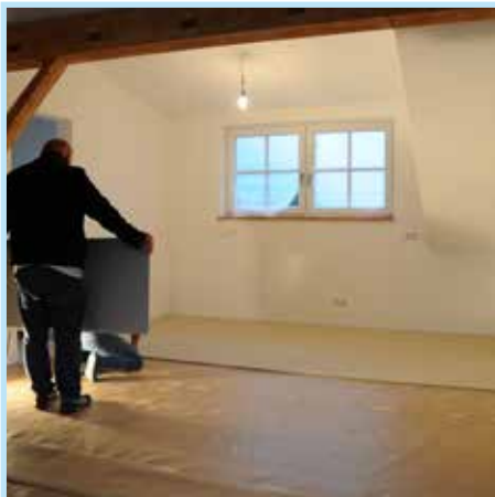
Boden Lage 5: Wolf Hugo N+F Gipsfaser-Trockenestrich