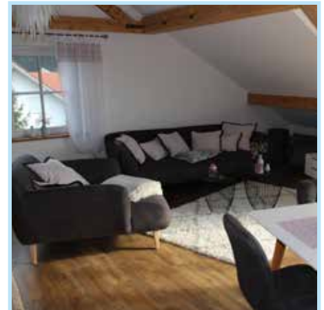
Endergebnis behagliche Wohnräume