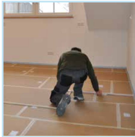
Boden Lage 2-3: 2 Lagen PhoneStar ST Tri Schalldämmplatten schwimmend im Verbund verlegt