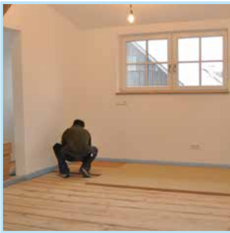
Boden Lage 1: Randausbau mit Randdämmstreifen und einer Lage Holzweichfaserplatten